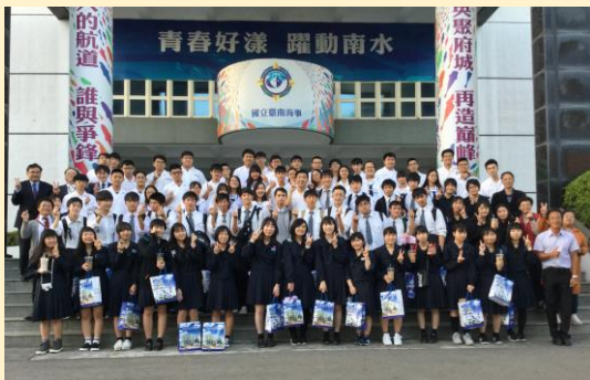
台南海事高級中学交流会

この研修では、語学力を高め、異文化理解を通じた視点を増やし、視野を広げることができました。