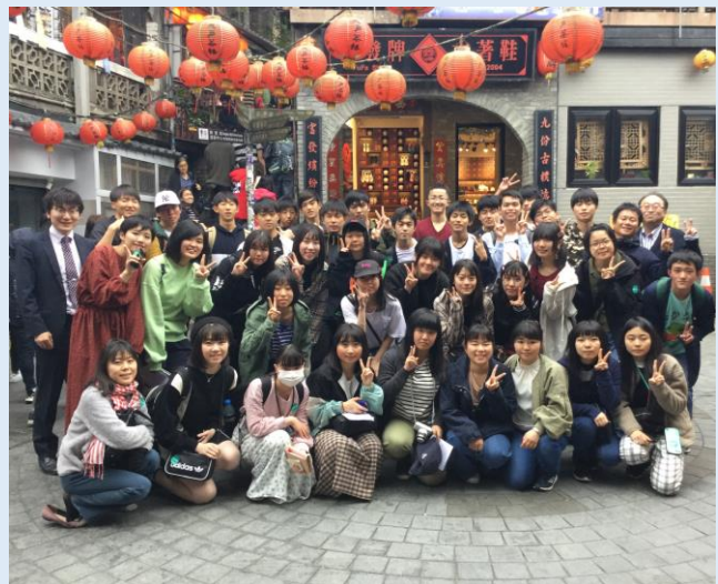
「千と千尋の神隠し」のモデルとなった九份での研修