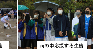
雨の中応援する生徒