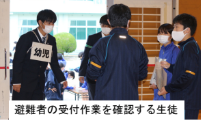
避難者の受付作業を確認する生徒