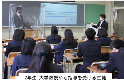
2年生 大学教授から指導を受ける生徒

東北大・宮城教育大・宮城大・東北工業大・法人まるオフィス・底上げ・合同コレルから多くの先生方をお招きし、生徒へのアドバイ