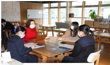
1年生 フィールドワーク PIER7にて

が高いものであったと、外部の講師の先生方がおっしゃっていました。会場では2年生が見学をして鋭い質問やアドバイスをし、大いに盛り上がった発表会となりました。