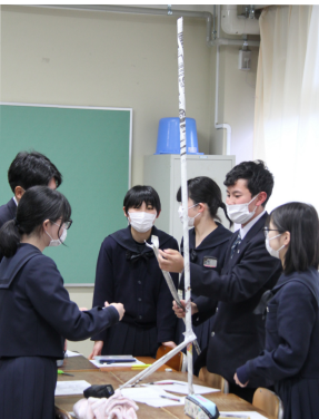
協力して新聞紙の塔をつくる生徒

12月13日(月)、ホームルーム企画で、全学年が混在する縦割りグループによる異学年交流会が実施されました。生徒たちは自己紹介後、新聞紙を使って制限時間内に、できるだけ高いタワーを作り、頂点にピンポン球を載せる課題に取り組みました。お互い仲良く協力して試行錯誤を繰り返して、中には天井まで届くタワーを作成するグループも出現しました。