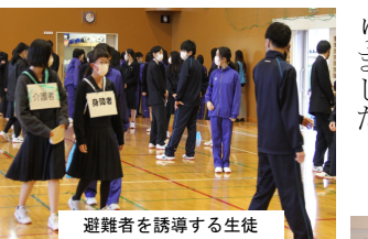
避難者を誘導する生徒

11月5日(金)に秋季総合防災訓練が実施されました。大地震による火災を想定し、グラウンドに迅速に避難した後、避難所開設のため、委員会ごと組織的行動をする訓練を行いました。運動祭実行委員は消火班として消火訓練を行い、放送委員は避難所の受付、代議員は避難者の確認・誘導を行いました。また、保健委員はケガ人の応急処置法やパーティションの設置方法等を消防署員から学びました。