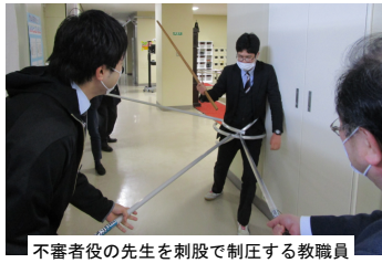
不審者役の先生を刺股で制圧する教職員