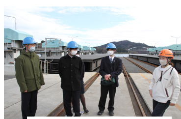
1年生 フィールドワーク (株)みらい造船にて