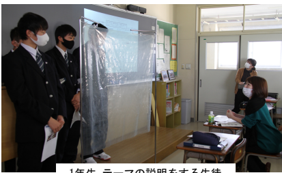
1年生 テーマの説明をする生徒

また、11月10日(水)は1年生が「地域社会研究」の中間発表を行いました。緊張の中どの生徒も堂々と発表を行い、内容もレベル