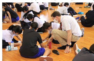
ワードマップ作成に熱心に取り組む1年生

グローバル化が進む社会において英語で発信する力が必要になっていきます。今回のワークショップで様々な手法をしっかり身に付け、英語力を向上させましょう!