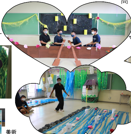
クラス制作 2-1 「塔の上のラプンツェル」