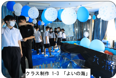
クラス制作 1-3 「よいの海」