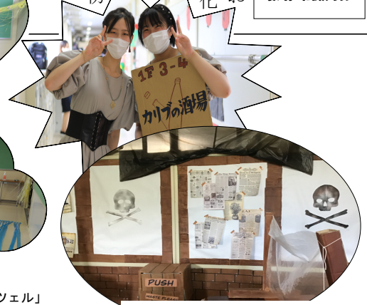
クラス制作 3-4 「カリブの酒場」