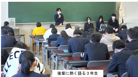
後輩に熱く語る3年生

2月2日(水)、「先輩の合格体験談を聞く会」が1・2年生を対象に実施され、3年生が自らの合格体験談を熱く語りました。3年生は、第一志望を決定するまでの経緯、合格・内定を勝ち取るま