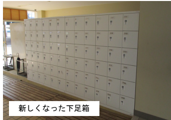
新しくなった下足箱