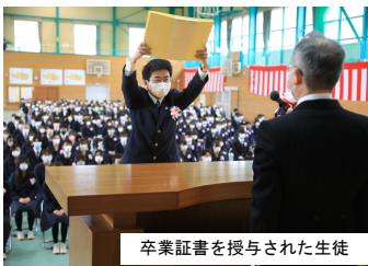
卒業証書を授与された生徒

2月28日(月)に皆勤賞・功績賞等の授与式、及び生徒会送別会が行われ、3月1日(火)に卒業式が厳粛に執り行われました。皆勤賞は三年間、無欠席・無遅刻・無早退・無欠課の生徒に贈られる賞で、26名の生徒に授与されました。また、功績賞の団体部門は、全国高校選抜フェンシング大会女子学校対抗フルール・ベスト8に進出したフェンシング部に授与され、個人部門で9名の生徒に授与されました。