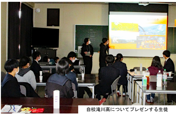
自校滝川高についてプレゼンする生徒

1月6日(木)に北海道滝川高校の生徒12名が来校し、本校の生徒会を中心に交流会が開催されました。交流会では、お互いの学校を紹介するプレゼンテーションに続き、本校生徒による東日本大震災に関する語り部活動が行われました。その後、小グループに分かれて、自己紹介やゲームなどを行い交流を深めました。交流会に参加した生徒は「滝川高校の生徒が熱心に話を聞いてくれたし、仲良くなれてうれしかった。連絡先を交換したので、今後も交流を続けたい」と語りました。