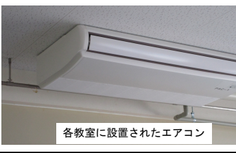
各教室に設置されたエアコン